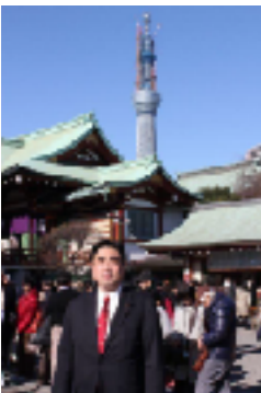
亀戸天神から見るスカイツリー

生活者主役の 地域主権時代幕開け 新春を心からお慶び申し上げます。 昨年、政権交代して初めての参議院選挙がおこなわれ、結果として国民の審判は、与党過半数割れという試練を与えました。私はある意味で当然だと思われました。戦後政治の問題点は、政治と金の問題もありましたが、しかし現在厳しい国民の目にさらされている中で、そのことよりも最も重要なことは政策の透明化、希望が持てる政策の具現化であります。残念ながらまだまだ国政における、財政計画や成長戦略を見ても、政策の提示や予算のあり方に分かりづらさがみられます。 そもそも民主党の一丁目一番地の政策は、地域主権改革です。その意味は、国民から頂く税金を、国民一人一人が納得できるように有効に配分していくこと。つまり地域が主体的に自主的な財源をもとに、地域経済や文化に即した政策を展開するところにあります。 今年の4月に全国で統一地方選挙がおこなわれます。江東区